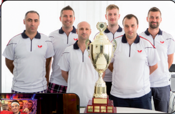
Mistr 2013-2014 STEN mark. HB Ostrov Havlíčkův Brod