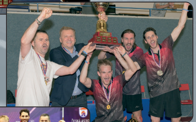
Mistr 2018-2019 SF SKK El Niño Praha