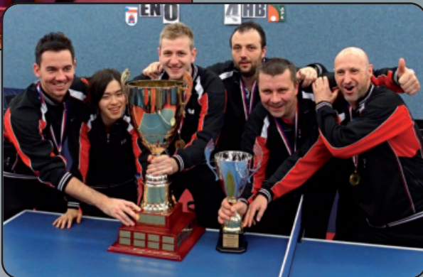
Mistr 2015-2016 STEN mark. HB Ostrov Havlíčkův Brod