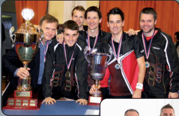
Mistr 2012-2013 SF SKK El Niño Praha