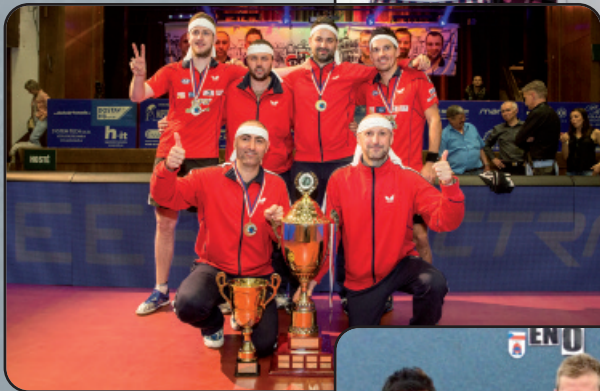
Mistr 2014-2015 STEN mark. HB Ostrov Havlíčkův Brod