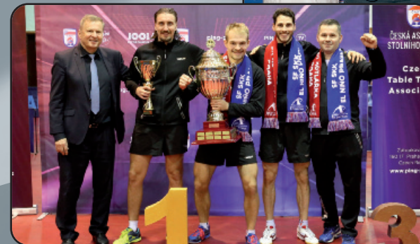
Vítěz Extraligy 2019-2020 SF SKK El Niño Praha