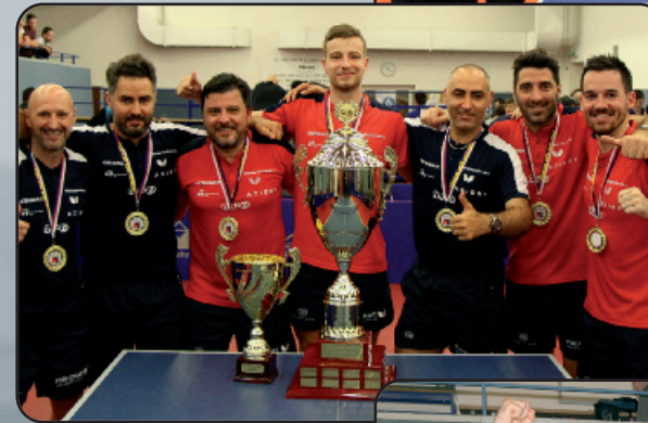
Mistr 2017-2018 Table Tennis Club OSTRAVA 2016