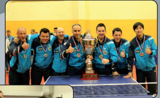
Mistr 2016-17 Table Tennis Club OSTRAVA 2016